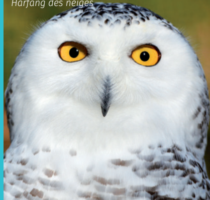
Harfang des neiges

Flamants roses, macaques de Barbarie, allée d'oliviers, jeu de senteurs... Dans l' odyssée Méditerranée , le dépaysement est garanti.